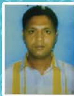
Sanjib Banerjee Sreenidhi Apartment Flat no - 2A

We have purchased a 3BHK flat at sreenidhi Apartment. We and our all relatives visited our flat on the occasion of Grahapravesh and they are entirely satisfied with the construction work and quality of products used in the flat for finishing. We are very much happy for fulfilling our DREAM HOME in time as committed by the SATYAM CONSTRUCTION PVT.LTD.