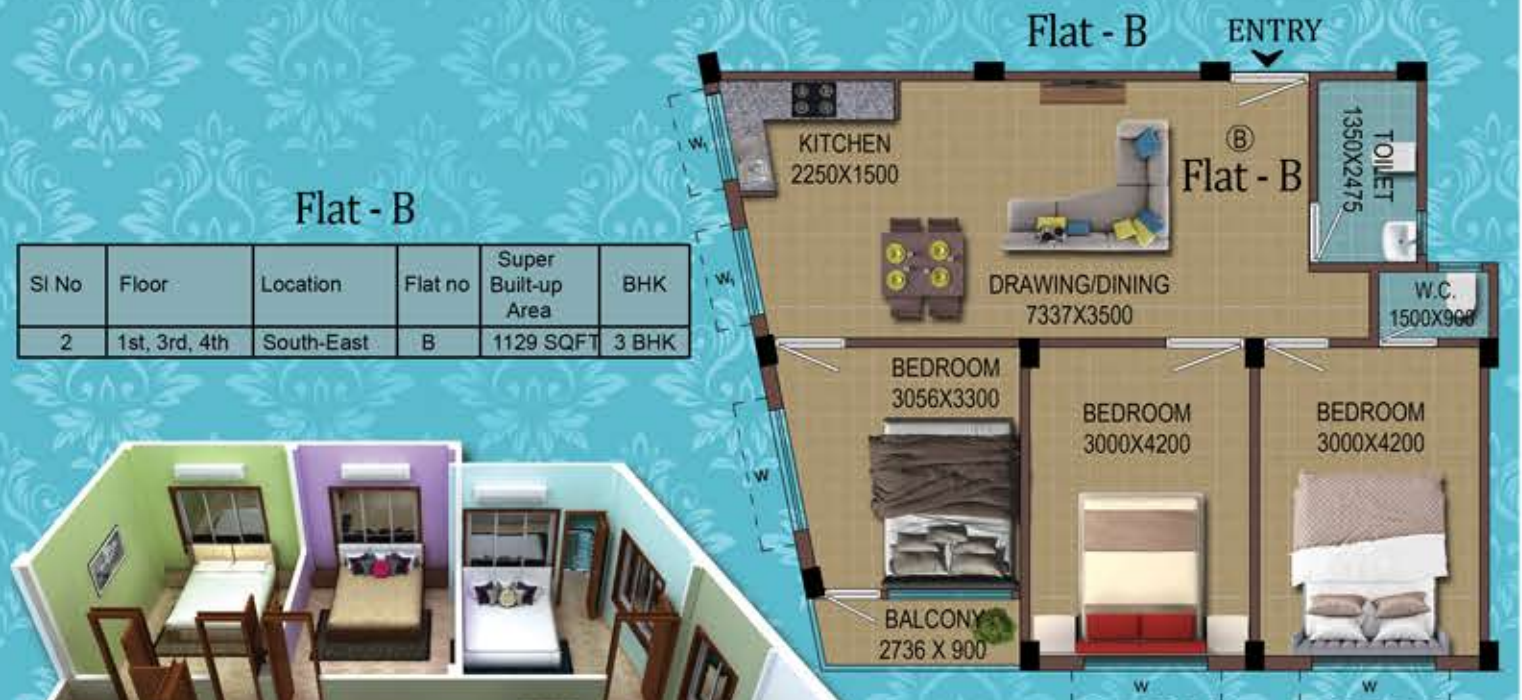
Flat - B