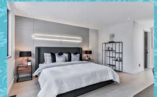
Flat - D