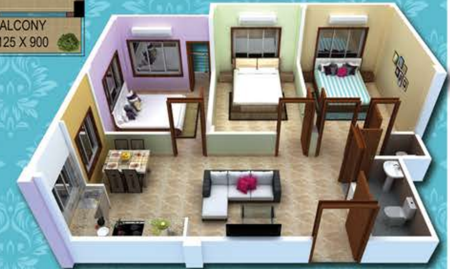
Flat - A