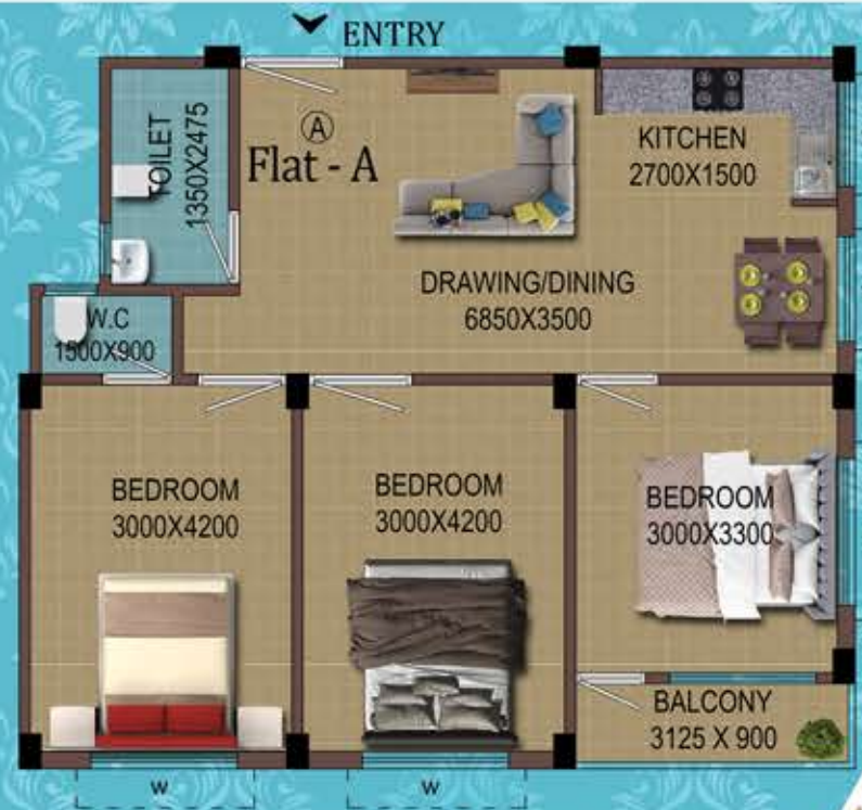
Flat - A